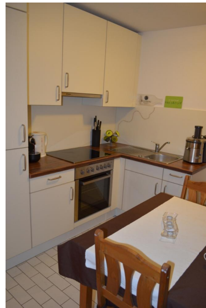
Küche mit Einbauküche