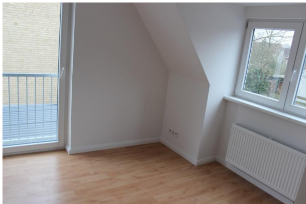
Schlafzimmer im DG