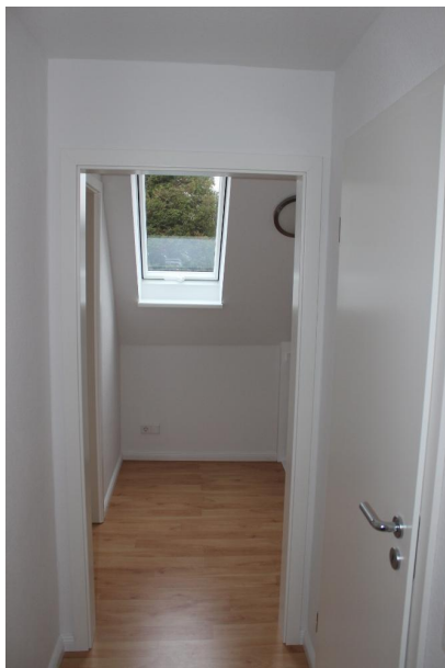
Flur im DG