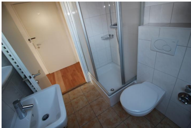
weitere Ansicht Badezimmer