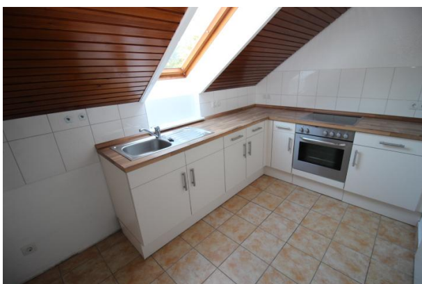
Küche mit Einbauküche